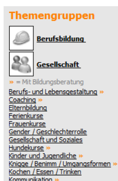
Abb. 3: Rubriken mit bereits besetzter Bildungsberatung sind mit » gekennzeichnet.