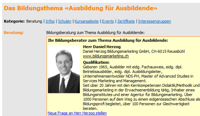
Abb. 4: Foto und Qualifikation eines Bildungsberaters

Nach Erhalt dieser Elemente (und wenn der nächste Punkt Nr. 3 auf dieser Seite erfüllt ist) können wir Sie als Bildungsberater aufschalten. Sie sind dann sofort auf der jeweiligen Landing Page ersichtlich, im Abschnitt «Beratung». Beispiel: